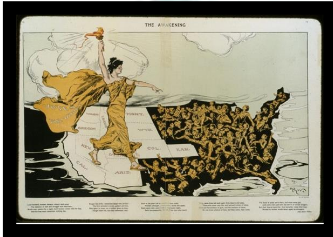
The Awakening (1915) : “El despertar” Fuente: Women’s Suffrage Movement . Disponible en: http://library.mtsu.edu/tps/sets/Primary Source Set--Womans Suffrage Across America.pdf